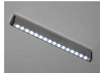
Breite 200 / 300 / 400 mm